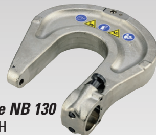
Étrier de rivetage NB 130 #CHR2430H