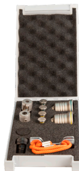
Kit 1 - Poinçonnage Ø6 mm + Ø8 mm #CHR2415H