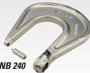
Étrier de rivetage NB 240 #CHR2431H