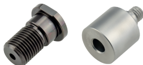
Adaptateur PNP90 sur XT 2 #CHR2417H