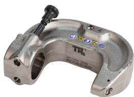
Étrier de rivetage NB 45 #CHR2412H