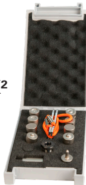
Kit 2 - Rivets pour fluoformage Formage, extraction SPR Ø6 mm + Ø8 mm #CHR2416H