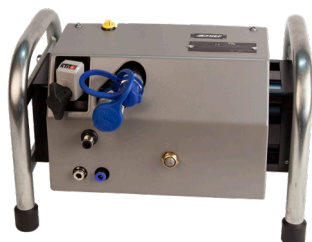
Multiplicateur de pression PNP90 SNW XT 2 #CHR2410H