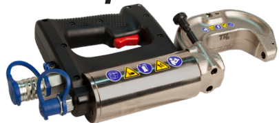
Pistolet hydraulique DN4-XT 2 #CHR2411H